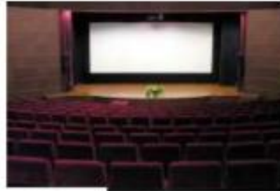
โรงมหรสพ