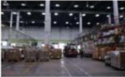
คลังสินค้า