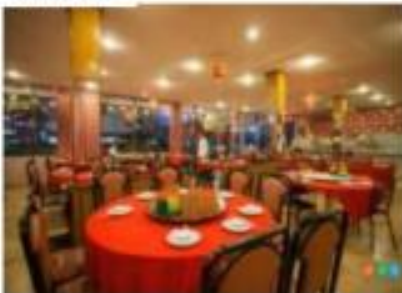
ภัตตาคาร