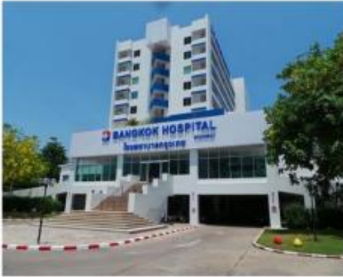
สถานพยาบาล