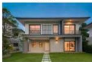
บ้านเดี่ยว