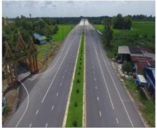
เสาไฟฟ้า