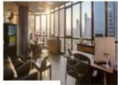
สำนักงาน