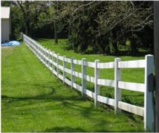
สถานคอนกรีต