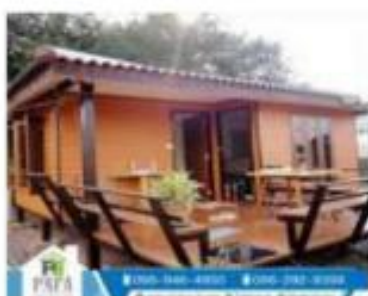
บ้านเดี่ยว (ประกอบสำเร็จ)