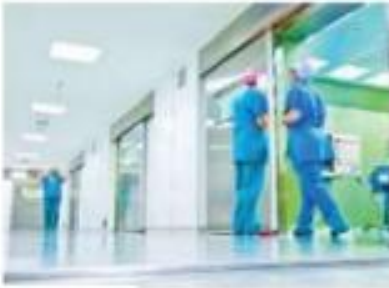
สถานพยาบาล