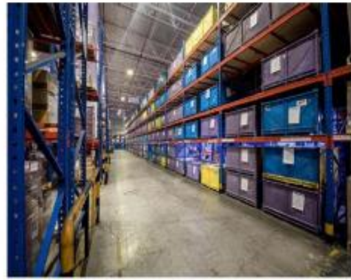
คลังสินค้า