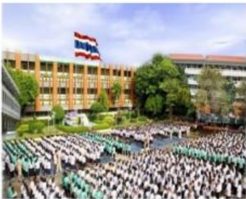
สถานศึกษา