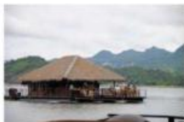
บ้านเดี่ยว (บ้านเรือนแพ)